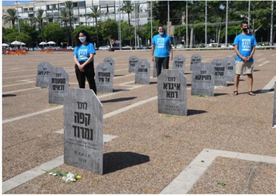
The Centers for Social Justice install a graveyard of businesses that have closed down during the coronavirus pandemic, August 26, 2020.