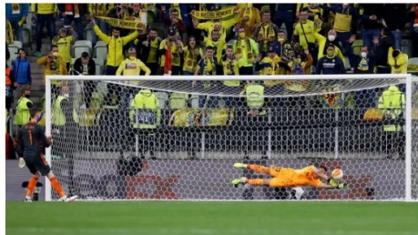
Rulli saves from De Gea to win the trophy

All outfield players scored their spot-kicks, as did Villarreal goalkeeper Geronimo Rulli before saving De Gea's penalty to win the shootout 11-10 and secure the first major trophy in their history.