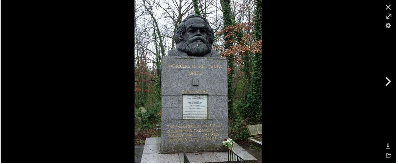
Karl Marx Tomb in London (Karl Marx Mezar Taşı - Londra)