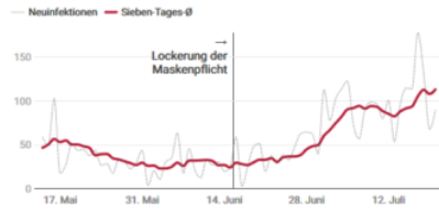
Grafik: Addendum • Quelle: BMSGPK

Anzahl bestätigter Neuinfektionen je Tag vor und nach der Lockerung der Maskenpflicht inklusive Sieben-Tages-Durchschnitt