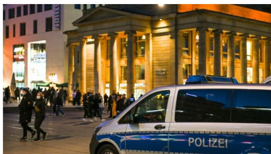
Die Ausgangssperre im Südwesten greift nun auch erst ab 22 Uhr. (Archivbild)