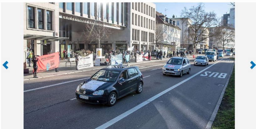
Querdenker veranstalten Autokorso

Location: Hellbrunn | Erstellt am: 21.02.2021 16:02 | Fotograf: Andreas Velgel