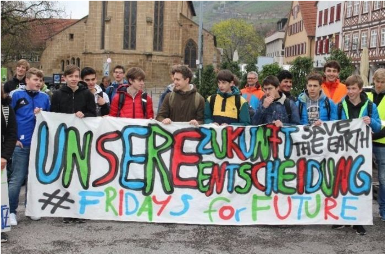
Fridays for Future in Esslingen.

Was kann es viel Beglückenderes für einen linxradikalen Juso, Schüler und Teenager der Jahre 1987-89 in Esslingen am Neckar geben (Abitur 1989), der schon damals Seminare zur Solarenergie mit seinen Genossen machte, nach Wackersdorf ging zum Demonstrieren (30.000 Leute, 1987), nach West-Berlin im September 1988 zum Mega-Schwarzen-Block-Anti-IWF/Weltbank-Treffen (wie unreflektiert deren Antiimperialismus auch immer gewesen sein mag, logo), als diesen Auftritt mit diesem T-Shirt an diesem symbolträchtigen Tag?