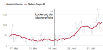
Grafik: Addendum

Anzahl bestätigter Neuinfektionen je Tag vor und nach der Lockerung der Maskenpflicht inklusive Sieben-Tages-Durchschnitt